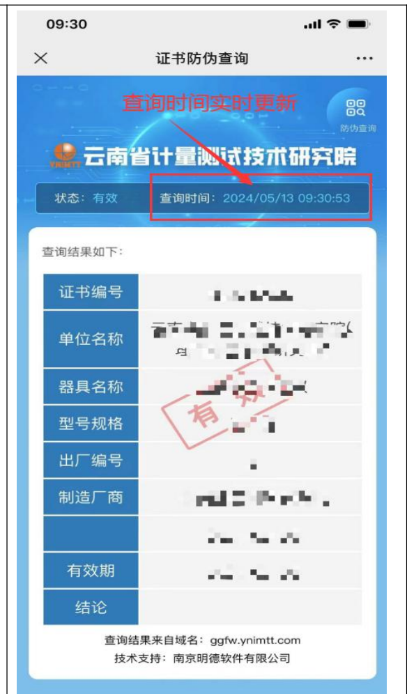
图 2 扫描封面二维码得到的信息