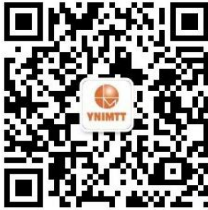
图3 云南省计量测试技术研究院微信公众号

在微信中搜索“云南省计量测试技术研究院”或者扫描二维码，关注我院微信公众号，进入之后如图4和图5所示进行操作。