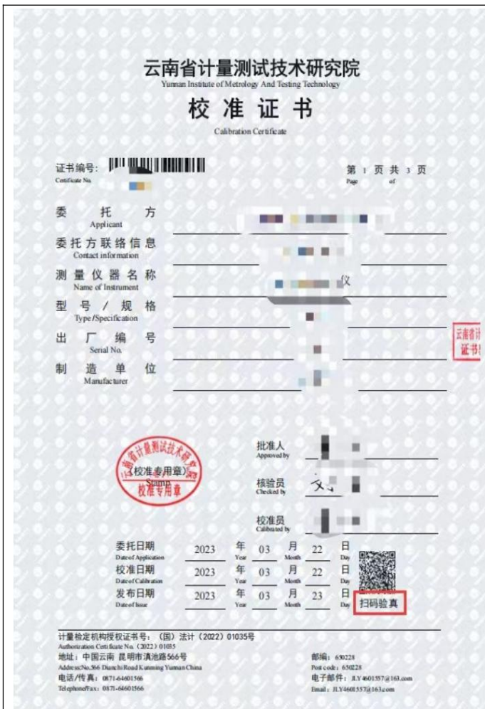
图 1 证书封面

我院出具的电子证书（除冷水水表、出租车计价器之外），封面上均带有二维码，器具使用方和监管部门均可以通过扫描该二维码进行证书真伪的查验。如图 1 所示，扫描证书的二维码可以进入图 2 所示界面，图 2 和图 1 的信息必须是一一对应，否则说明证书是假的。如有疑问请联系我院帮您处理。